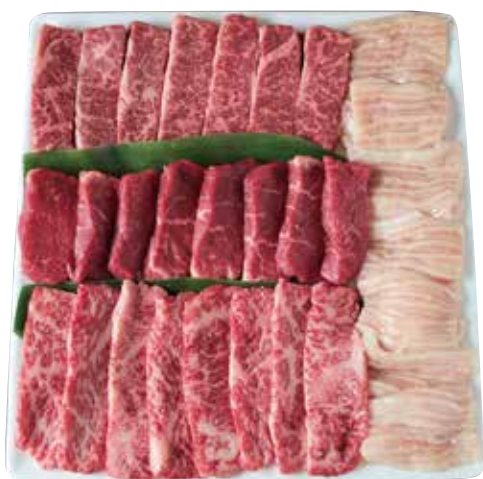
牛の美味しさをとことん味わう