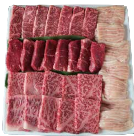
黒毛和牛カルビを使った自慢の盛合せ